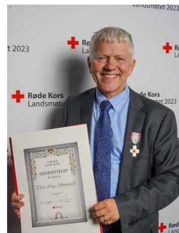
Røde Kors landsmøte