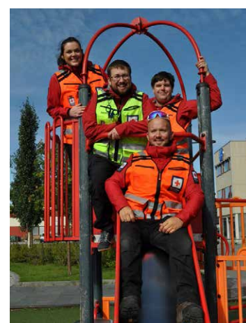
NM for hjelpekorps