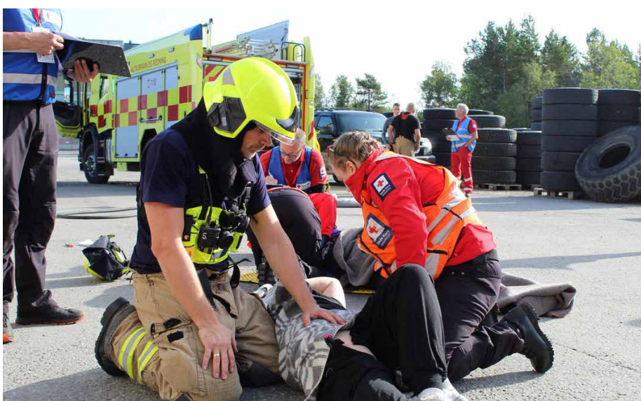
NM-samarbeid med brannvesenet