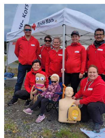
Sør-Varanger Røde Kors