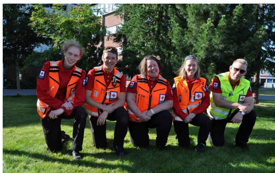
Møre og Romsdal