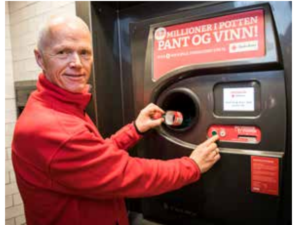
Pantelotteriet bidro med 50 millioner kroner til Røde Kors i fjor. Robert Mood er takknemlig for støtten.