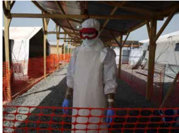
Godt beskyttet: På oppdrag i Sierra Leone iført fullt beskyttelsesutstyr mot ebola.