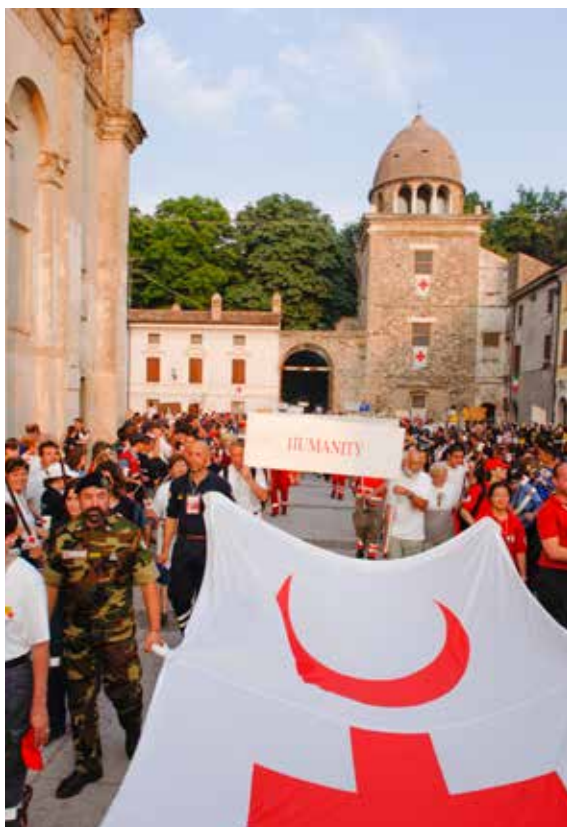
Markeringer: Frivillige fra Røde Kors over hele verden kommer hvert år til Solferino i Italia for å markere opprettelsen av Røde Kors.