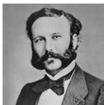
Grunnleggeren: Sveitseren Henry Dunant var initiativtaker til opprettelsen av Røde Kors og den aller første Genèvekonvensjonen.

Genèvekonvensjonene er de eneste avtalene i huma-