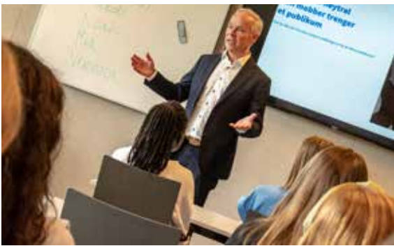
Klasse 9 D ved Bjørnegård skole i Bærum var vertskap da Nye Bruk Hue ble lansert i mai. – Dette var den beste skoletimen jeg har vært på, sa Kunnskapsminister Jan Tor Sanner.

«Jeg har mange krevende elever, men i denne timen fulgte de virkelig med. De hadde store øyne.»