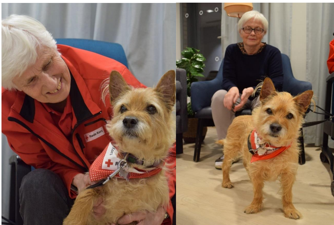
Bilde: Besøkvenn med hund på Carpe Diem

Utfordringer: Vi har endel potensielle besøkvenner med hund, men det er begrenset med plasser på hundekurs så det tid å få ekvipasjer gjennom «utdanningen».