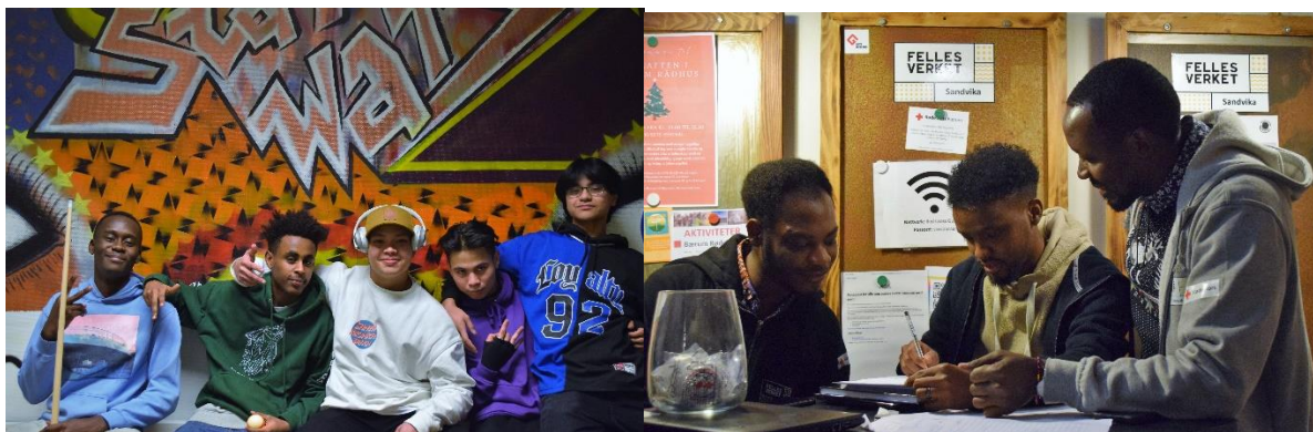
Bilde: Ungdommer på biljard-rommet og ved innsjekk

Høstferie: I høstferien hadde vi vanlig åpning to dager, i tillegg til at vi arrangerte «Kreativ uke» i samarbeid med «Framtidskunst» i hele fire dager. I forbindelse med en av åpningsdagene dro vi på bowling. En dag omgjorde vi hele huset til et «Escape room», i tillegg til to utflukter; en til Risenga svømmehall og en til Trampolineparken på Grini.