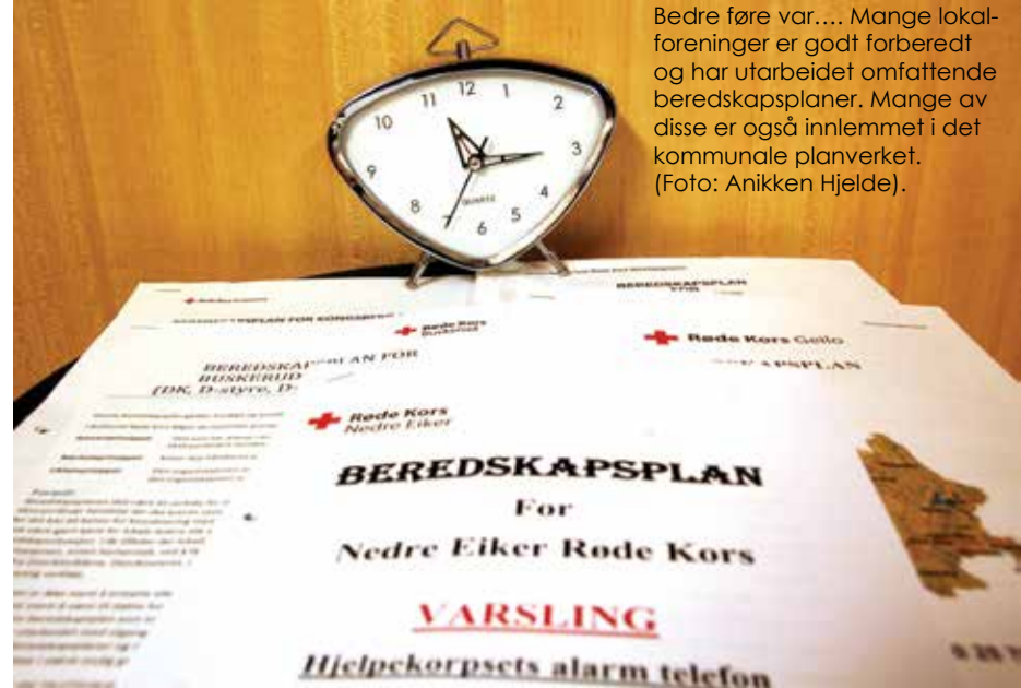
Bedre føre var.... Mange lokalforeninger er godt forberedt og har utarbeidet omfattende beredskapsplaner. Mange av disse er også innlemmet i det kommunale planverket.

Flere av våre lokalforeninger har laget sine egne beredskapsplaner. Innholdet i disse planene varierer, men i hovedtrekk inneholder de en oversikt over ressurser som