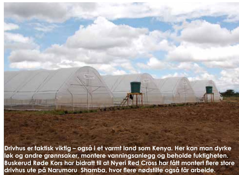
Drivhus er faktisk viktig – også i et varmt land som Kenya. Her kan man dyrke løk og andre grønnsaker, montere vanningsanlegg og beholde fuktigheten. Buskerud Røde Kors har bidratt til at Nyeri Red Cross har fått montert flere store drivhus ute på Narumoru Shamba, hvor flere nødstilte også får arbeide.

Mange av de aller fattigste er svært hardt rammet av hudsykdommen Tungiasis, hvor den såkalte «jigger flie» legger egg under huden på føttene til de som går barbeinte på jordgulvet i de små hyttene sine, larver klekkes og de spiser seg vei. Denne mannen har nesten ikke tær igjen på føttene sine. Røde Kors gir et legende fotbad og salve til de som lider, for de har ingen mulighet til å oppsøke helsehjelp selv.