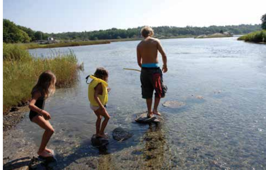
Barn trenger gode sommerferieminner, og når de treffes på leir, så blir det mange fine opplevelser og nye vennskap.

19 voksne og 30 barn fikk innvilget sin søknad om ferieopphold. Reisen gikk med buss fra Hønefoss, via Vikersund og Drammen til Kristiansand. På Haraldvigen ventet mange opplevelser, og senteret tilbyr en spennende aktivitetsmeny; havfiske, fjordfiske, garnfiske, krabbe-fiske med teiner, nattfiske etter krabber,