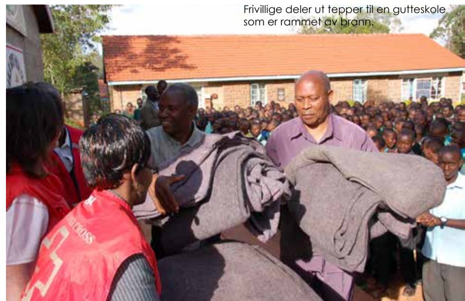
Frivillige deler ut tepper til en gutteskole som er rammet av brann.