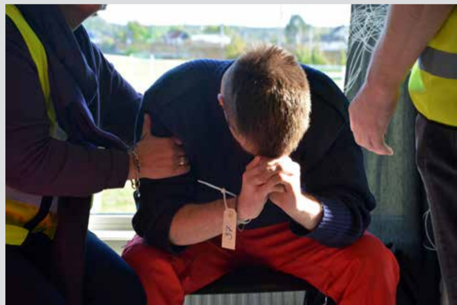
Frivillige i hjelpekorpsen vet aldri helt hva som vil møte dem på ulike søks- og redningsoppdrag, og den mentale påkjenningen kan være like stor som den fysiske.

–Det ble søkt i et stort geografisk område og vi hadde motiverte og dedikerte mannskaper som la ned en formidabel innsats, kan en fornøyd aksjonsleder meddele.