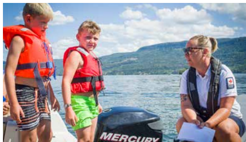
SAR båten s. 4 og 5