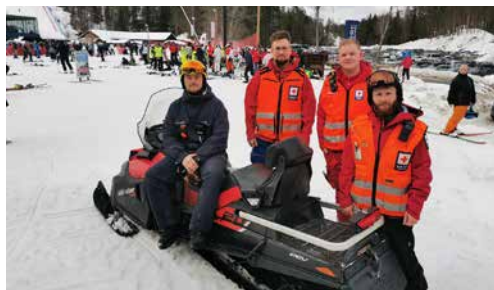
Frivillige i bakken s. 8