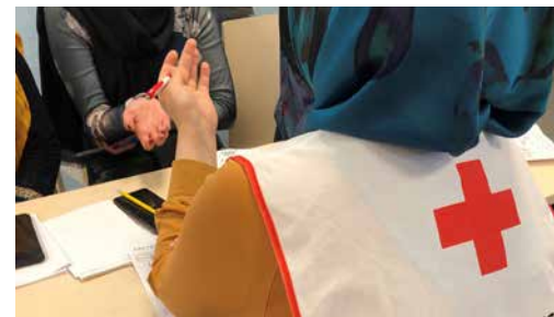
Frivillige og integrering s. 12 og 13