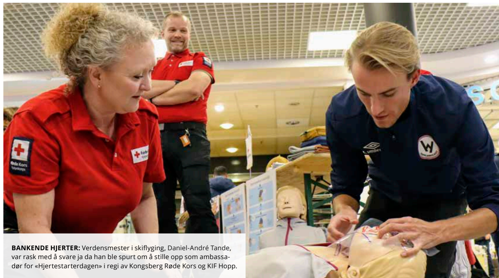
BANKENDE HJERTER: Verdensmester i skiflyging, Daniel-André Tande, var rask med å svare ja da han ble spurt om å stille opp som ambassadør for «Hjertestarterdagen» i regi av Kongsberg Røde Kors og KIF Hopp.