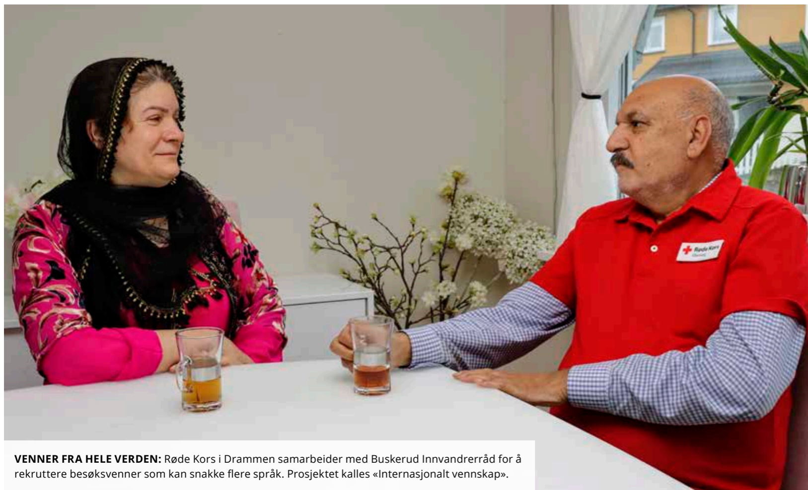
VENNER FRA HELE VERDEN: Røde Kors i Drammen samarbeider med Buskerud Innvandrerråd for å rekruttere besøkvenner som kan snakke flere språk. Prosjektet kalles «Internasjonalt vennskap».