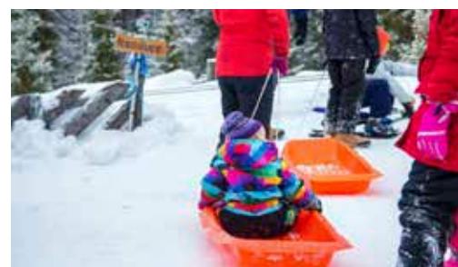
«Ferie for alle» tar aldri fri s. 6