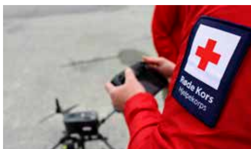
Droner hjelper hjelpekorpsset s. 11