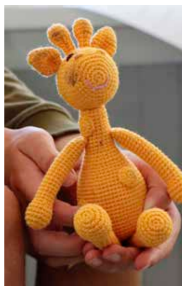
NÅR SJIRAFFEN SNAKKER: Det er en effektiv måte å kommunisere på – og kan løse mange konflikter.

TEKST OG FOTO: ROBERT WALMANN / RØDE KORS