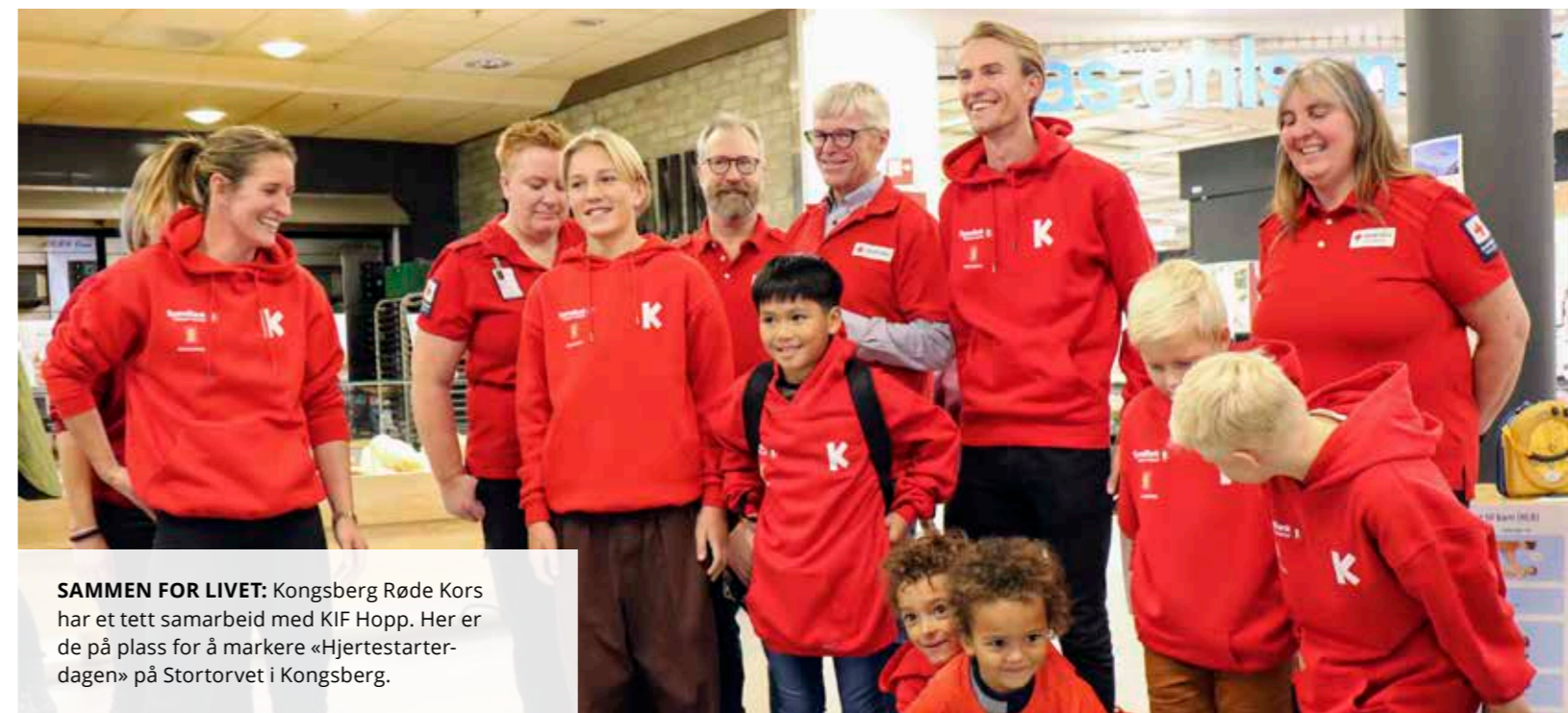
SAMMEN FOR LIVET: Kongsberg Røde Kors har et tett samarbeid med KIF Hopp. Her er de på plass for å markere «Hjertestarterdagen» på Stortorvet i Kongsberg.