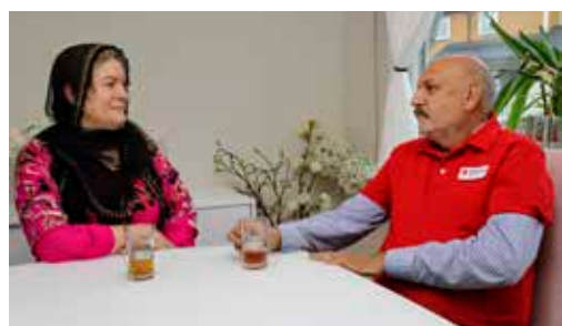
Besøksvenn med flere språk s. 6

Det er et stort og velsmurt apparat som settes i sving når hjelpekorpsset rykker ut. s. 8