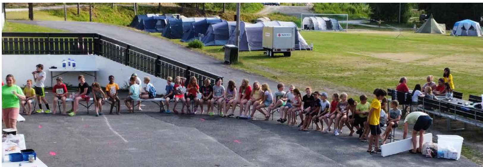
Daglig godteri-kø på BARK-leir.