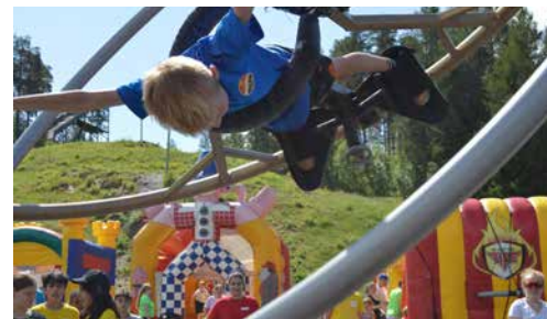
BARK-leir s. 14 og 15