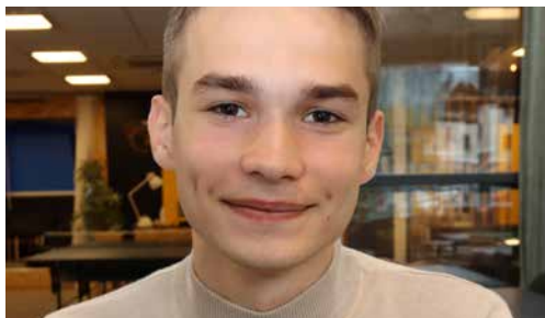
På studietur fra Moldova s. 8 og 9