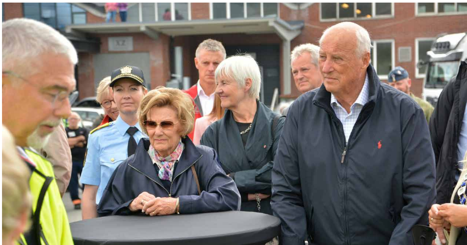
IMPONERT KONGEFAMILIE: – Jeg må bare berømme de som har stått på og reddet det som redde kunne. Vi er imponert over innsatsen, sa Kongen og Dronningen da de besøkte Nedre Eiker Røde Kors