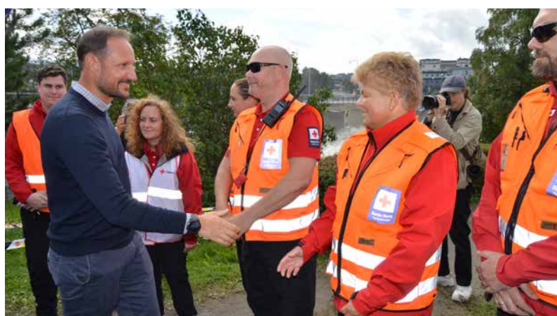
KRONPRINSEN TAKKER: Kronprins Haakon kunne konstatere at det var voldsomme krefter i sving på Ringerike. Han kom også for å takke alle de frivillige som stod på natt og dag.