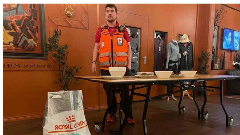
HUNDEMAT PÅ HOTELL: Omsorgsfrivillige har bistått med å etablere og drifte EPS (evakuering og pårørendesenter flere steder i Buskerud. Også hunder må ha mat.