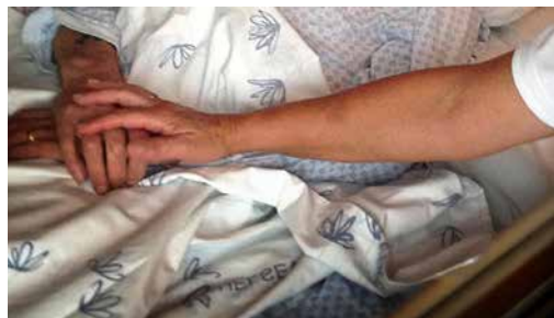
Ingen skal dø alene s. 4 og 5

Kongefamilien, statsministeren og medlemmer fra regjeringen stod i kø for å se hvordan Røde Kors og øvrig frivillighet reagerte da «Hans» flommet over landet. De de fikk se var en innsats som savner sidestykke i Røde Kors-historien i Norge. Side 10