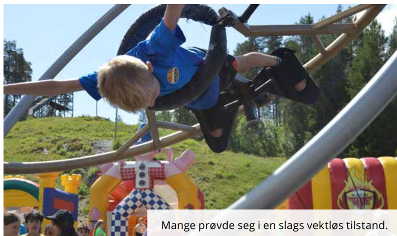
Mange prøvde seg i en slags vektløs tilstand.