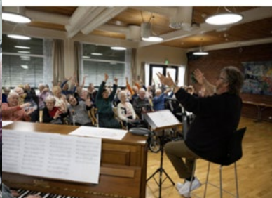
Det mangler ikke på dyp patos og ekte innlevelse i huskoret på Røde Kors sykehjem.