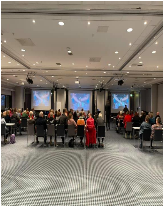
Foto: Nordland Røde Kors Fagsamling Radisson BLU hotell i Bodø

Høsten 2021 var det endelig fagsamling i Bodø med ca 90 deltakere der de frivillige kunne møtes igjen med fokus på oppvekst, omsorg, og digitale støtteverktøy i redningstjenesten.