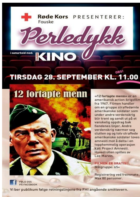
Kinotilbud til eldre i regi av Fauske Røde Kors

Nordland Røde Kors mottok i 2020 tilskudd fra Helsedirektoratet gjennom Statsforvalter i Nordland til prosjekt «Vi står han a». Midlene skulle gå til aktivitetstiltak for å motvirke ensomhet blant eldre som bor hjemme i 2020-2021.