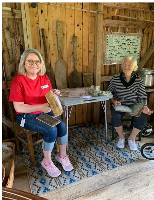
Eldre i Rana på gårdsbesøk

I 2016 ble besøksvenn med hund startet opp som aktivitet i Nordland.