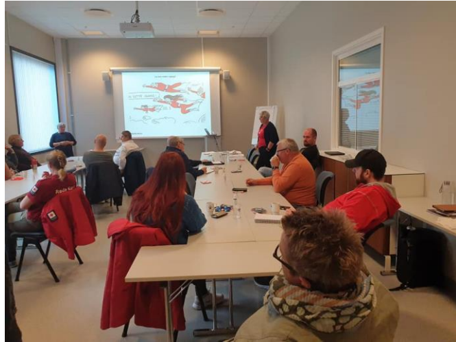
Foto: Nordland Røde Kors Områdesamling for lokalforeninger i Vesterålen

Erfaringsutveksling, samarbeid og workshops i forhold til bl.a rekruttering og iverksetting av aktiviteter sto på programmet. Hjelpekorpsene arbeidet med plan for styrking av kompetanse i redningstjenesten i Vesterålen.